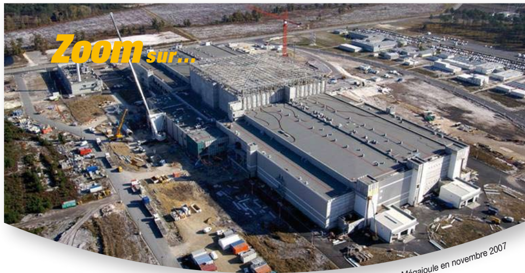
Le chantier Laser Mégajoule en novembre 2007