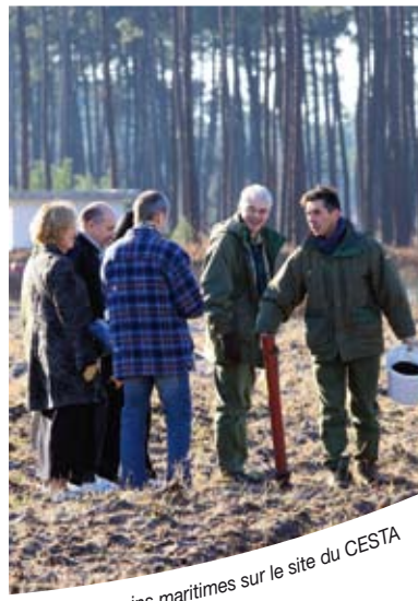
Plantation de pins maritimes sur le site du CESTA