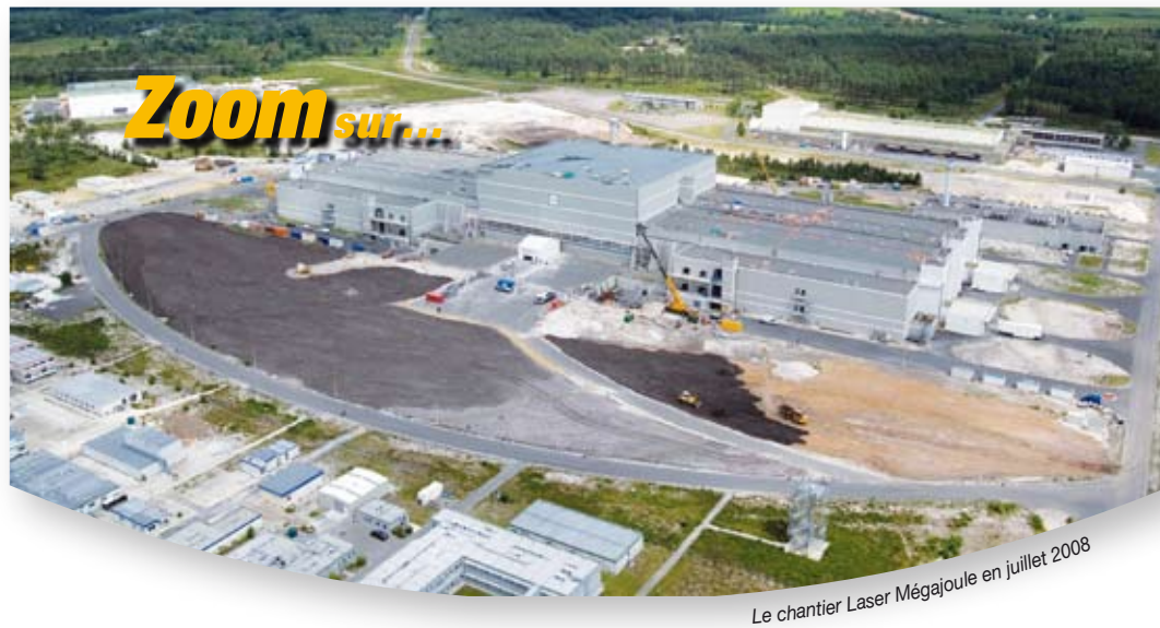
Le chantier Laser Mégajoule en juillet 2008