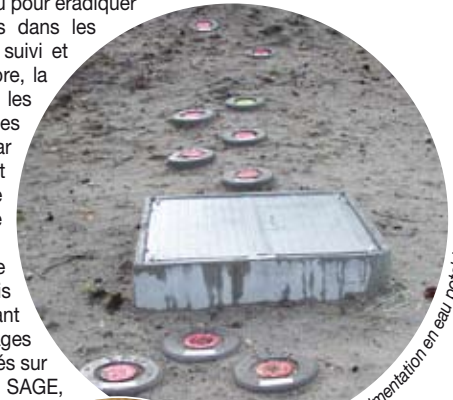
Forages pour alimentation en eau potable.

Dans un souci constant de protection de son environnement et de ses ressources, le CESTA maintient son effort en faveur d'une bonne gestion de l'eau en planifiant, notamment, l'amélioration du réseau de secours incendie.